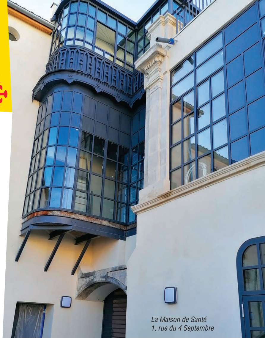
La Maison de Santé 1, rue du 4 Septembre