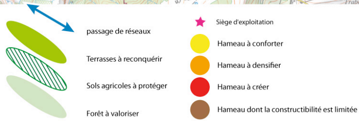
Carte synthétisant les orientations du PADD