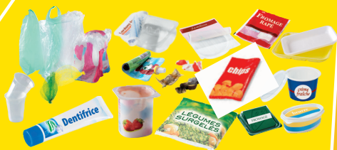
Tous les autres emballages en plastique (pots, barquettes, films, sacs, filets, suremballages...)