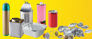
Emballages en métal, même petits