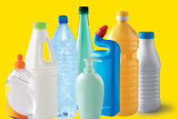
Bouteilles et flacons en plastique Bien vidés, avec les bouchons

POUR VOUS, LE TRI EST SIMPLE ! Des solutions ont été trouvées sur notre territoire pour ne pas jeter et pour recycler plus. De votre côté, il suffit de déposer dans la même colonne tous vos emballages et papiers !