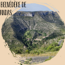
LE BELVÈDÈRE DE BLANDAS