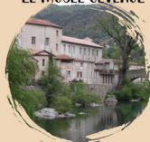
LE MUSÉE CÉVENOL