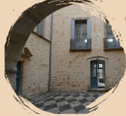
LE MUSÉE DE LODÈVE