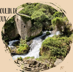
LE MOULIN DE LA FOUX