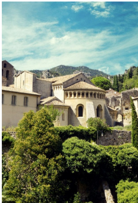
Gorges de l'Hérault

Le Cœur d'Hérault compte trois Grands Sites sur son territoire. Une concentration exceptionnelle en France qui démontre la qualité de paysages uniques. Bien que fragiles, ils sont gérés, préservés et entretenus dans une perspective de développement durable concertée, collective et transparente à long terme.