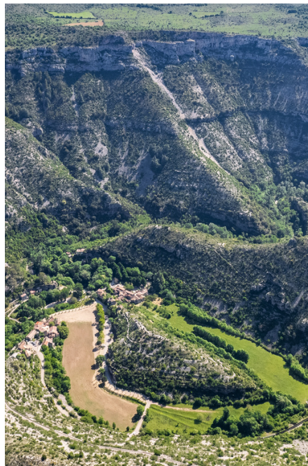
Cirque de Navacelles