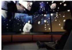
DES PIERRES EXTRATERRESTRES

La première étape de ce voyage convie le visiteur sur Terre : autour de récits de chutes et de trouvailles de météorites, de l'histoire de leurs représentations et des conséquences des impacts géants.