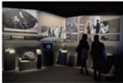
TOMBÉES DU CIEL

La première étape de ce voyage convie le visiteur sur Terre : autour de récits de chutes et de trouvailles de météorites, de l'histoire de leurs représentations et des conséquences des impacts géants.